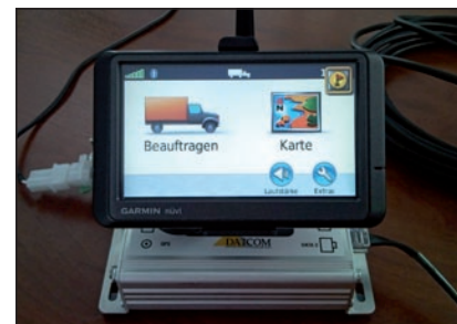
DATCOM S-Box plus Navigation sind für den Fahrer eine wichtige Hilfe

Kundenspezifische Projektanforderungen können so einfach umgesetzt werden.