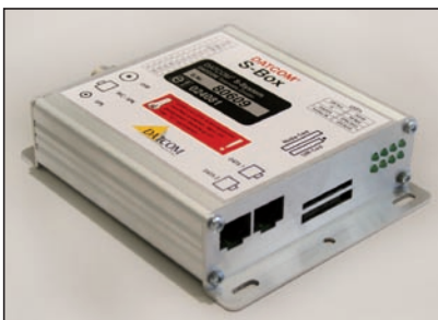
DATCOM S-Box Onboard-Computer des Telematik-Systems