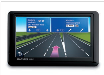
Garmin Navigation 4,3 bis 5 Zoll Navigationslösungen