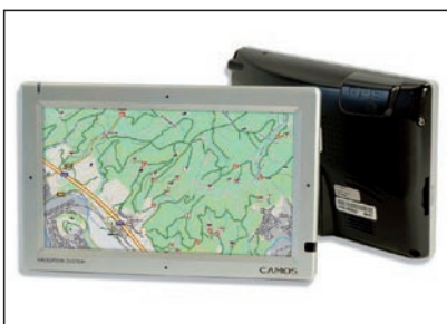
Windows CE Terminal 7 Zoll Bildschirm mit Navigation